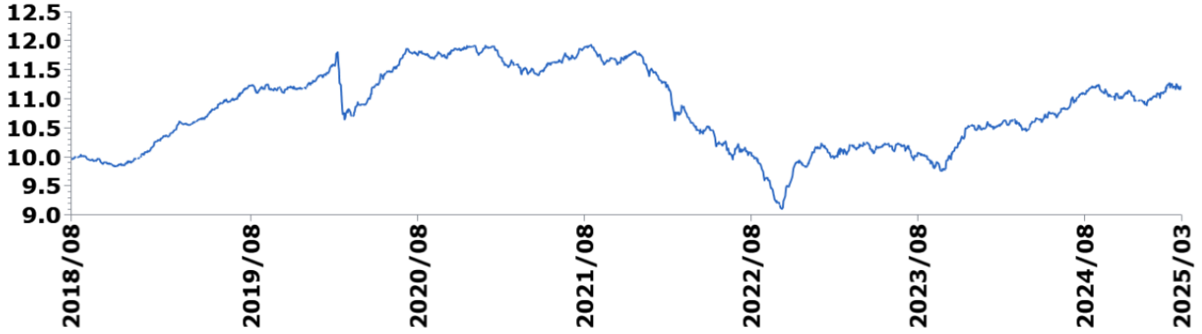
— 瀚亞投資-亞洲優質債券基金A(美元)* * 包含估計資料。